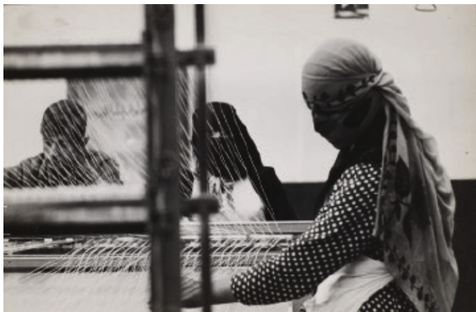
In einer Weberei, Jemen, 1963 © Ingrid Becker-Ross Troeller