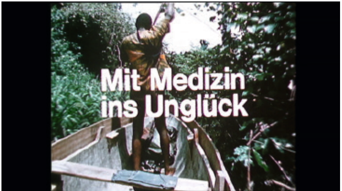
Filmstill Mit Medizin ins Unglück , Gabun 1975, aus der Reihe: Im Namen des Fortschritts

At the heart of this presentation is the Deffarge & Troeller archive, which provides deep insights into their work and the media landscape of the time. Over 100,000 negatives, slides and prints as well as films, tapes and research material provide a diverse overview of the creation of the reports through to their reception. With the first comprehensive retrospective combining their photo and film reports, the work of these two journalists can now be rediscovered.