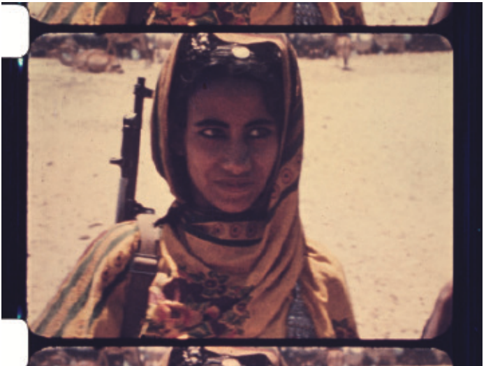
Junge Kämpferin in Dhofar, 1969, Filmstill: Das Sultanat Oman, 1971

Mit der ersten umfassenden Retrospektive, die ihre Foto- und Filmreportagen vereint, ist das Werk der beiden Journalist:innen jetzt wiederzuentdecken.