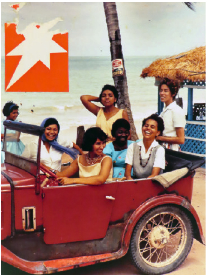
Layout-Entwurf für den Stern , Brasilien 1961 © Ingrid Becker-Ross Troeller